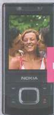
NOKIA 6500 slide

Еще больше удовольствия — телефоны от 1 Ls.