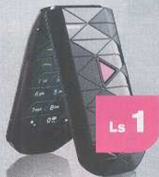
NOKIA 7070 Prism

Для каждого заказчика, для каждого объекта найдется подходящий дизайнер — нужно лишь найти его. Как это сделать, вы узнаете в ближайших номерах «Люблю!».