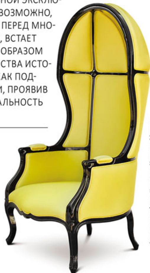
Фото: пресс-фото. Коллажи: Наталья Митина